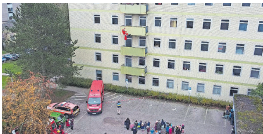
Der Nikolaus kam von ganz oben, um die Kinder des Klinikums Saarbrücken und der Kita Winterberg zu überraschen.

In den vergangenen Jahren gab es immer wieder vereinzelte Aktionen von Einheiten der Höhenrettung in der Vorweihnachtszeit, bei denen an Krankenhäusern, Kinderkrankenhäusern oder Hospizen Patientinnen und Patienten kostümiert besucht wurden. In diesem Jahr sollte die Aktion bundesweit durchgeführt werden. Dazu hatten Vertreter der Feuerwehren Hamburg und Ulm aufgerufen.