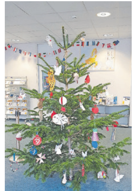
Der Schmuck des europäischen Weihnachtsbaums stammt von europäischen Grundschulen.

E-Mail: europe-direct@saarbruecken.de Internet: www.eiz-sb.de , www.facebook.com/EuropeDirectSaarbruecken www.instagram.com/europe-directsaarbruecken