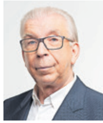
Dr. Helmut Isringhaus

empfeht sie sektorübergreifend regional zu planen. Speziell im Saarland ist dieses Level interessant für die Krankenhausversorgung der verschiedenen Regionen. Krankenhäuser, die jetzt mit Problemen wegen der bestehenden Fallpauschalen und der Personalnot konfrontiert sind, haben nun die Möglichkeit, sich umzustellen auf ein integriertes Versorgungskonzept mit ambulanten und stationären Leistungen. Belegärzte können hier das Spektrum vervollständigen. Für die Beteiligten gilt es jetzt schnell zu handeln. Die FDP ruft daher alle auf, sich zusammen zu setzen, um auf der Grundlage der Krankenhausreform ein zukunftsfähiges Konzept für das EVK und somit die Bürger in Saarbrücken zu erarbeiten. Die Reform könnte so ein verfrühtes Weihnachtsgeschenk sein.