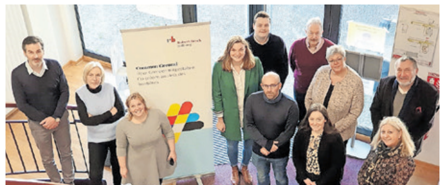
Vertreterinnen und Vertreter der Robert Bosch Stiftung, von EUROP'Age, des Eurodistricts, der Landeshauptstadt, des Nexus-Instituts und des Gemeindeverbands Forbach bei der Kick-Off-Veranstaltung.

Landeshauptstadt Saarbrücken Büro des Oberbürgermeisters und Internationale Beziehungen Rathausplatz 1, 66111 Saarbrücken Telefon: +49 681 905-1420 E-Mail: common-ground@saarbruecken.de Internet: www.saarbruecken.de/commonground