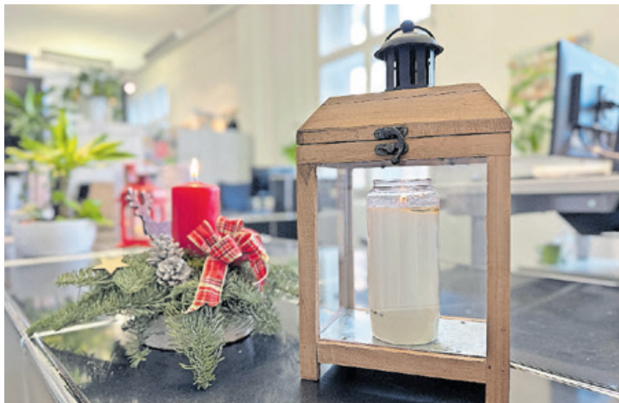
Das Friedenslicht steht noch bis zum 23. Dezember an der Infotheke im Rathaus St. Johann.