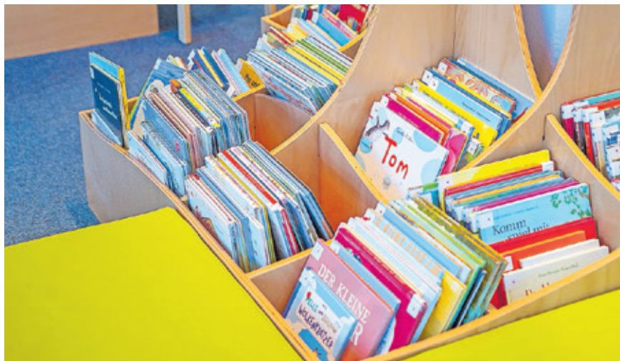
Beim „Vorleseschatz“ dürfen die Kinder ein Buch aus der Bücherkiste der Kinderbibliothek auswählen.