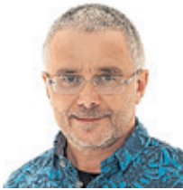
Rainer Ritz

das untragbar, besonders jetzt, wenn diese Gruppen sich intensiv um mehr Menschen mit besonderen sozialen Schwierigkeiten kümmern müssen. Deshalb beantragten wir die fehlenden Mittel.