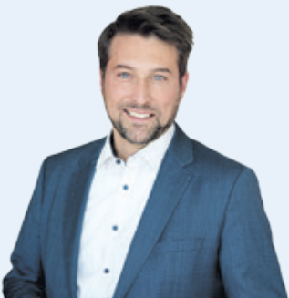
Uwe Conrads Oberbürgermeister der Landeshauptstadt Saarbrücken

Ich wünsche Ihnen und Ihrer Familie friedvolle und entspannte Weihnachtsfeiertage.