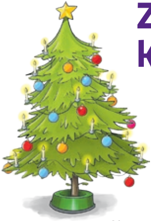
Grafik: Jürgen Schanz