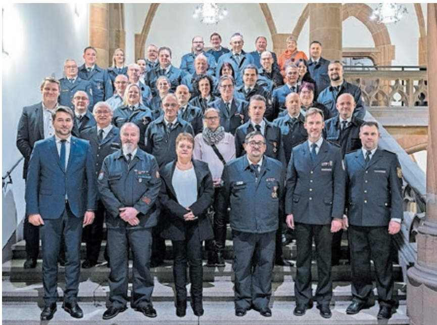
Oberbürgermeister Uwe Conradt (erster von links, vorne) und Verwaltungsdezernent Sascha Grimm (dahinter) mit den geehrten Kameradinnen und Kameraden.

sprechende Auszeichnungen und dankte ihnen für ihr großes Engagement. Darüber hinaus erhielten einige Kameradinnen und Kameraden eine besondere Ehrung durch den Feuerwehrverband.