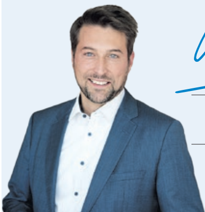
Uwe Conradt Oberbürgermeister der Landeshauptstadt Saarbrücken

Es gibt also bei allem, was uns belastet, viele Gründe, auch das Gute im zurückliegenden Jahr zu sehen. Wir können zuversichtlich sein, dass wir auch wieder bessere Zeiten erleben werden. Mit Zusammenhalt, Mut und Kraft können wir gemeinsam unsere schöne Stadt Saarbrücken auch in diesen Zeiten weiter voranbringen. Ich wünsche Ihnen einen guten Start ins Jahr 2024.