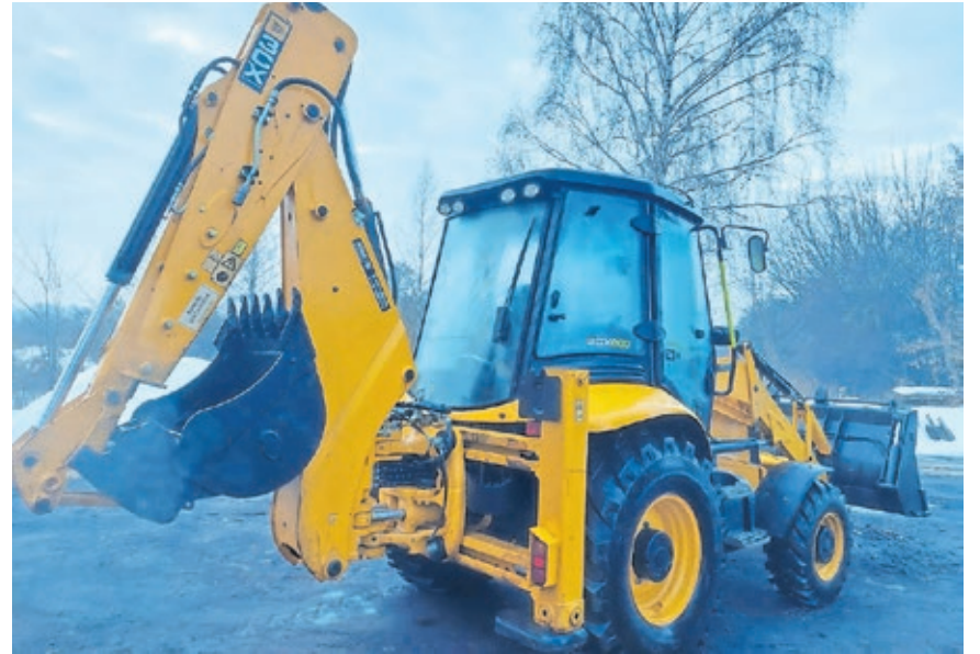
Das Multifunktionsgerät ist ein Hilfsmittel für den Wiederaufbau in Kowel.