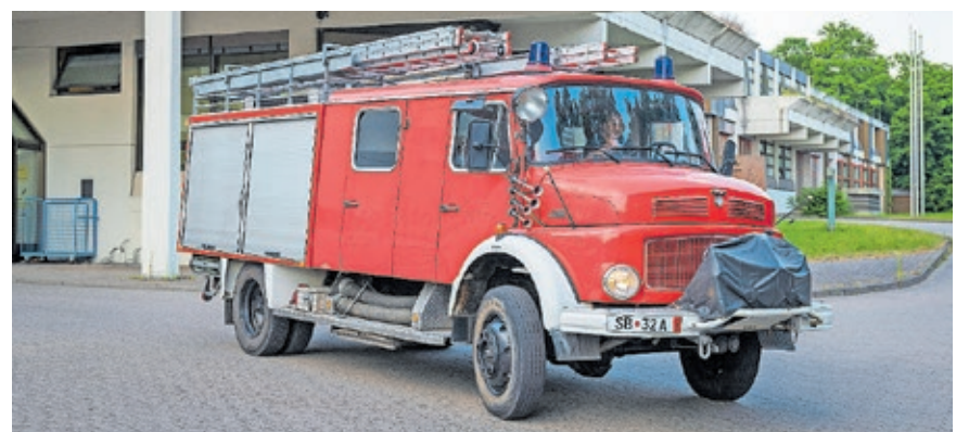
Dieses Löschfahrzeug war das erste von drei ausgemusterten Feuerwehrfahrzeugen, das als Schenkung in die Stadt Kowel überführt wurde.

Die Stadt Kowel liegt im Nordwesten der Ukraine und hat rund 70.000 Einwohnerinnen und Einwohner.