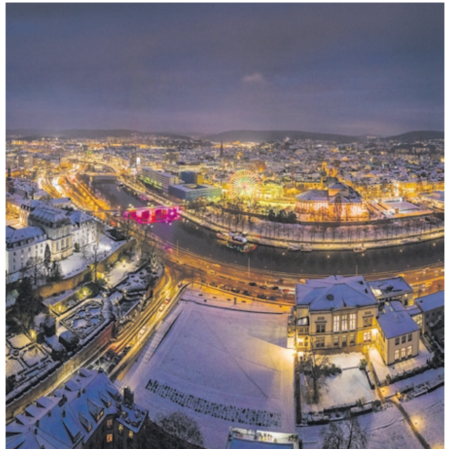
Die Weihnachtsstadt Saarbrücken lädt ihre Gäste dazu ein, die Adventszeit in der City zu genießen.

Die Tradition des „Fliegenden Weihnachtsmanns“ wird auch dieses Jahr wieder mit Leben gefüllt. Jeden Tag erscheint er um 17 und 19 Uhr in Begleitung seines Engels im Schlitten hoch über dem St. Johanner Markt und erzählt eine weihnachtliche Geschichte – ein vor allem für die kleinen Gäste besonderes Erlebnis. Nach den 17 Uhr-Vorstellungen dürfen Kinder, die kleiner als 1,40 Meter sind, wieder eine Stunde lang kostenlos im großen Riesenrad auf dem Tbilisser Platz mitfahren. Wer auch in unseren Breitengraden ein bisschen Wintersport treiben möchte, kann sich in der Bahnhofstraße auf die Kunststoffeisbahn wagen – für alle Generationen ein beliebter Treffpunkt zum Schlittschuhfahren.