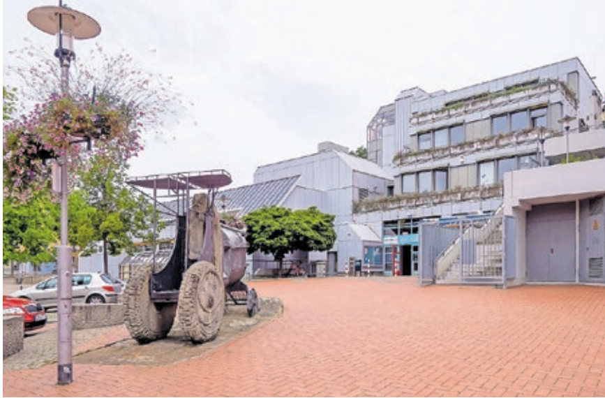
Das Bürgeramt West in Burbach wird im November weiter modernisiert.

Das Bürgeramt West in Burbach bleibt von Donnerstag, 21. November, bis Dienstag, 26. November, wegen abschließender Umbaumaßnahmen geschlossen.