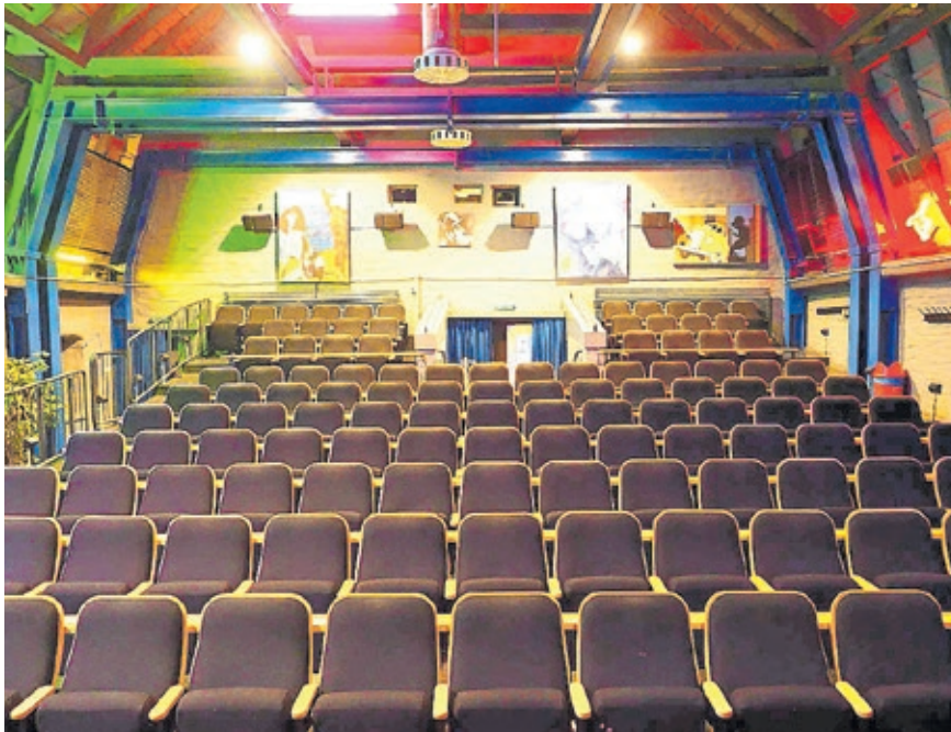
Das Filmhaus erwartet spannende Gäste im Rahmen der neuen Reihe „Wie wird man was mit Film?“