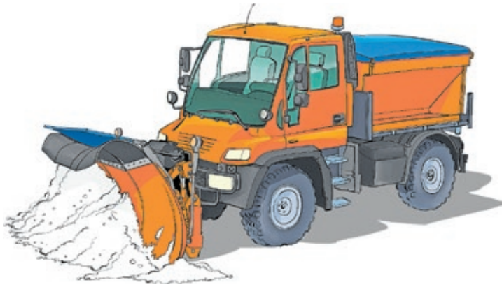
Grafik: Jürgen Schanz