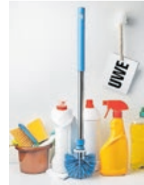
Melmut Frankhalter Die FRAKTION der Partei Die PARTEI

In der kommenden Stadtratsitzung geht es um den Haushalt '25. Alles wird teurer und das bereitet Ihnen, liebe Wähler*innen, natürlich Sorgen. Die Stadt braucht mehr Geld für Personal, Infrastruktur und Zeugs. Einsparungen wären wichtig, aber damit tut sich Uwe traditionell eher schwer. Deshalb sind nun Sie, liebe Wähler*innen, mit Sparen dran (#DankeUwe). Sie können das! Wir wissen es! Deshalb