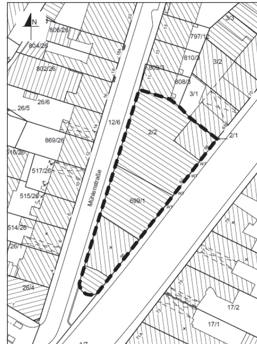
Übersichtsplan ohne Maßstab Geltungsbereich BBP131.03.04

Der in die Jahre gekommene Gebäudekomplex steht teilweise unter Denkmalschutz und ist sanierungsbedürftig. Der Bereich stellt folglich derzeit einen städtebaulichen Missstand dar, bietet aufgrund seiner zentralen und gut angebundenen Lage aber zahlreiche Möglichkeiten der städtebaulichen Entwicklung und Aufwertung in Richtung eines neuen und modernen innerstädtischen Gebäudekomplexes. Hierbei soll das denkmalgeschützte Gebäude der Dudweilerstraße Nr. 58 saniert und mit einem Ersatzneubau im Bereich der Dudweilerstraße 60 und 66 ergänzt werden.