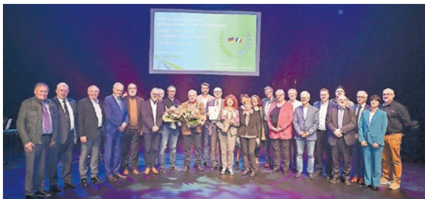
Die Verleihung des Preises für grenzüberschreitende Zusammenarbeit fand in Freyming-Merlebach statt.

Der Eurodistrict SaarMoselle verleiht den Preis für grenzüberschreitende Zusammenarbeit alle zwei Jahre. Er wird durch die politischen Vertreter der jeweiligen Gebietskörperschaften übergeben.