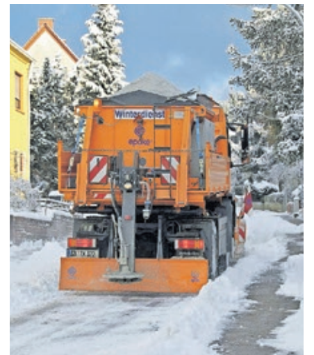
30 Räum- und Streufahrzeuge sowie 40 Kleinfahrzeuge stehen der Landeshauptstadt für den Winterdienst zur Verfügung.