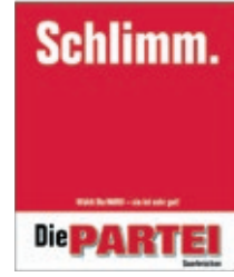
Melmut Frankhalter

rigen Fraktionen fehlt wohl die Weitsicht für ein solches Projekt. Ebenfalls abgeschmettert wurde unser Antrag, der die Umwandlung der momentanen Betonwüste, die sich Landwehrplatz nennt, in lebenswerten Raum zum Ziel hatte sowie die Errichtung einer Uwe-Statue anstelle des sündteuren Neubaus des Congresszentrums. Hier stand den „Kollegen“ zweifelsfrei der Fraktionszwang im Weg. Gerne würden wir Sie an dieser Stelle noch über unsere weiteren tollen Vorschläge informieren; leider wurde aber auch der Antrag auf zusätzlichen Platz in diesem Mitteilungsblatt negativ beschieden. Keine Überraschung, haben die übrigen Fraktionen doch generell eh wenig Substantielles zu sagen. Und damit verabschieden wir uns für heute. Wie immer vornehm, Ihre FRAKTION.