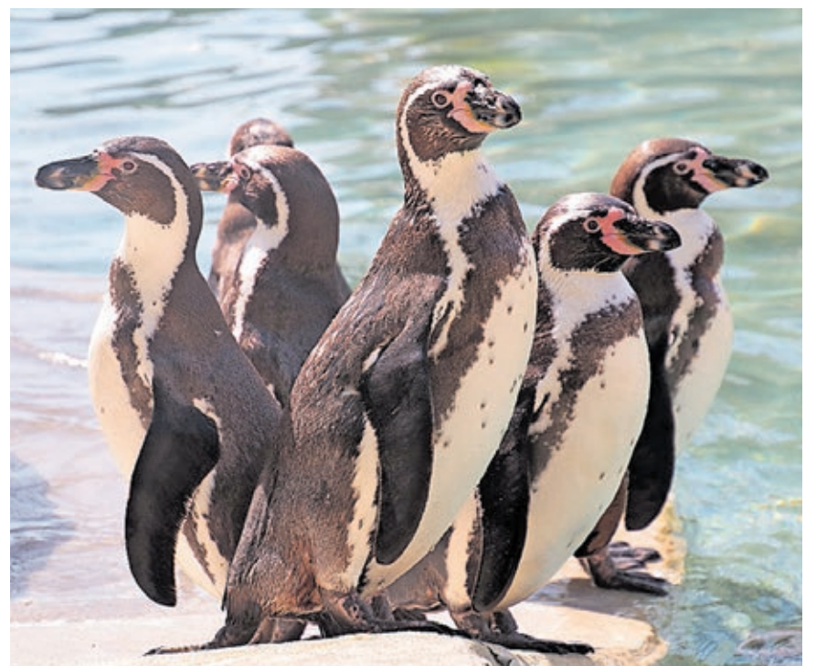
Die Pinguine haben eines der Motive für den diesjährigen Zookalender geliefert.

Der Saarbrücker Zoo ist mit rund 200.000 Besucherinnen und Besuchern jährlich eine der größten Attraktionen der Landeshauptstadt Saarbrücken. Er beherbergt etwa 1.000 Tiere aus mehr als 100 Tierarten. Der Zoo ist täglich geöffnet.