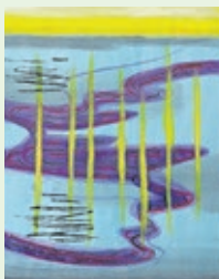
Werke des Künstlers Werner Constroffer