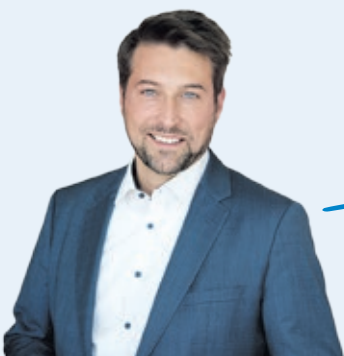
Uwe Conradt Oberbürgermeister der Landeshauptstadt Saarbrücken

Ich wünsche Ihnen frohe Weihnachten und wunderbare Feiertage.