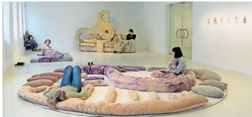
Die aktuellen Ausstellungen „Fragmente einer geteilten Geschichte“ (l.) und „Well Beings“ laden zum Anschauen und Mitmachen ein.