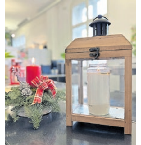
Das Friedenslicht aus Bethlehem ist ab Mitte Dezember an der Infotheke im Rathaus St. Johann zu finden.