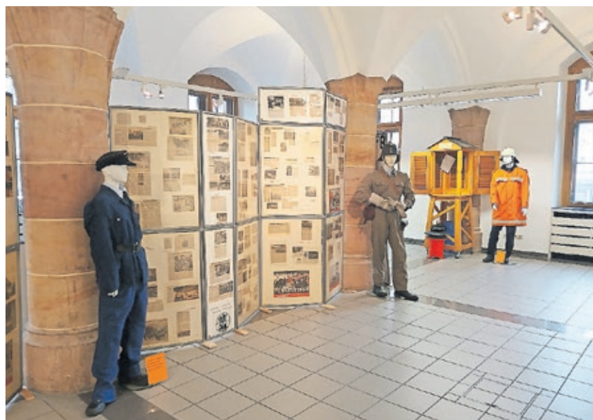
Noch bis zum 20. Dezember können Interessierte im Hauberrisser Saal im Rathaus St. Johann mehr über die Geschichte der Feuerwehr erfahren.

an Einsätze, Ausbildung, Einsatzfahrzeuge und Ausrüstung widerspiegelt. Besucherinnen und Besucher können auf eine Zeitreise durch die vergangenen