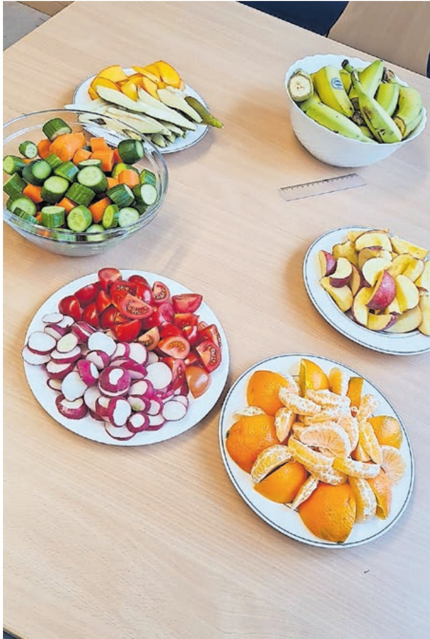
Selbst geschnippeltes Obst und Gemüse gehören in der Grundschule Rastpfuhl fest zum Schulalltag.