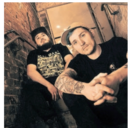
Das Duo „Romans Nailed It“ aus Saarbrücken trat in der Partnerstadt Nantes auf.

Nantes und das Café Exodus in Kooperation mit den Städten Saarbrücken und Nantes im Rahmen des Programms „Junge Botschafter“.